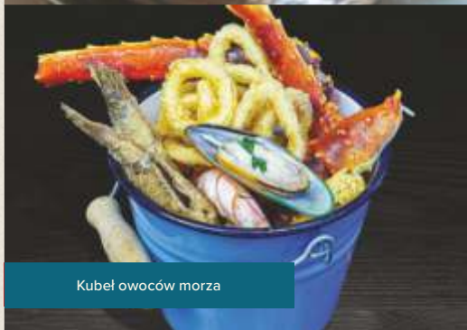
Kubel owoców morza