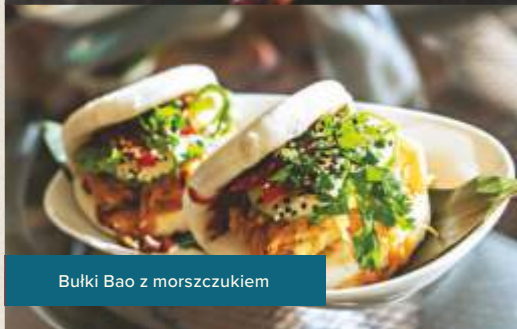
Bułki Bao z morskczukiem