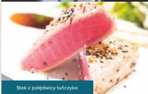
Stek z polędwicy tuńczyka